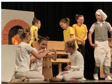
Fotografija prizora iz Pekarne Mišmaš, šol. leto 2016/2017.

OCENE: Učenci bodo pridobili po eno ustno oceno v ocenjevalnem obdobju.